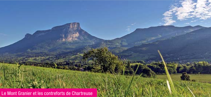
Le Mont Granier et les contreforts de Chartreuse