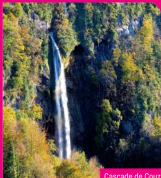
Cascade de Couz

Berceau de l'ordre des pères Chartreux, l'émeraude des Alpes, comme aimait à la définir Stendhal est devenue un Parc naturel régional en 1995.