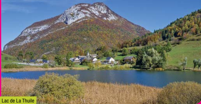
Lac de La Thuile