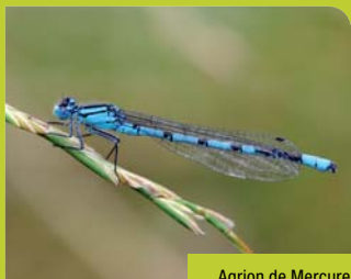
Agrion de Mercure