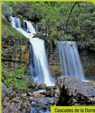
Cascades de la Doria