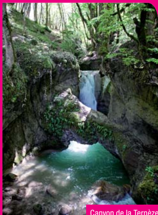
Canyon de la Ternèze

GR 96 : chemin de la traversée des Préalpes du Nord. Démarrant en Haute-Savoie, à Samoëns, il gagne le lac d'Annecy avant de grimper vers les Bauges. Cet itinéraire permet de relier les massifs des Bauges et Chartreuse, en 3 à 4 jours de marche. Il traverse la cluse de Chambéry en passant à proximité de la gare avant d'aboutir à Entremont-le-Vieux en Chartreuse.