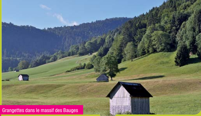
Grangettes dans le massif des Bauges

Parc naturel régional depuis 1995 et Geopark depuis 2011, le massif des Bauges saura vous séduire autant que vous surprendre... Vous pourrez le découvrir à travers un réseau de